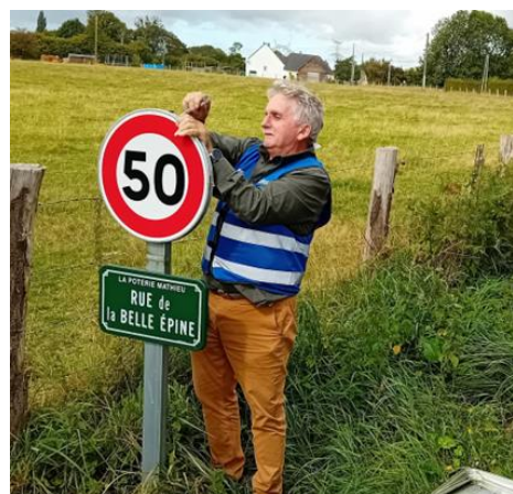
Installation nouveaux panneaux Jeudi 11 septembre