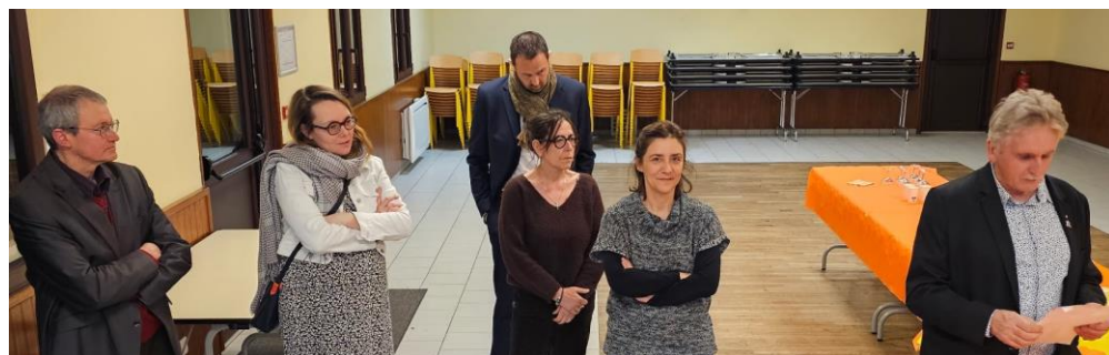
Vœux du maire Vendredi 23 janvier 2026