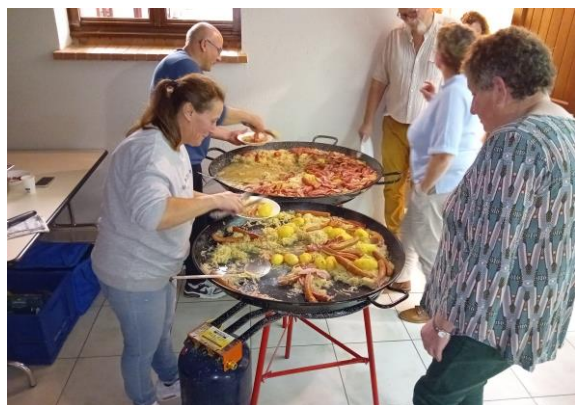
Soirée dansante choucroute Samedi 11 octobre 2025