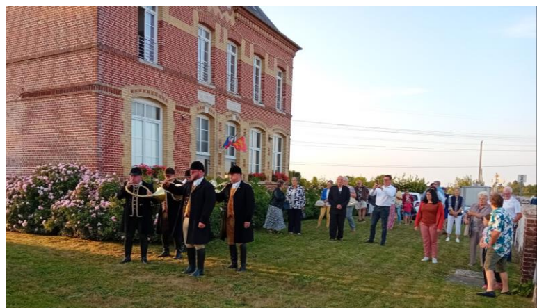
Fête de la Saint Louis Samedi 23 août 2025