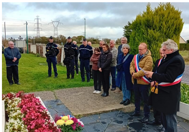
Commémoration du 11 novembre 2025