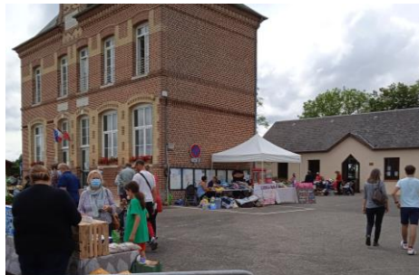
La foire à tout Le dimanche 11 juillet 2021