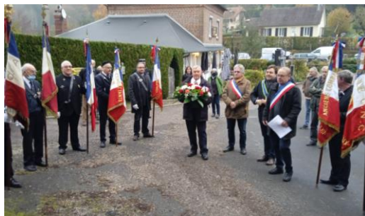
Commémoration avec Saint Siméon et la Noé Poulain Le jeudi 11 novembre 2021