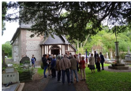
La fête de la Saint Louis Le samedi 21 août 2021