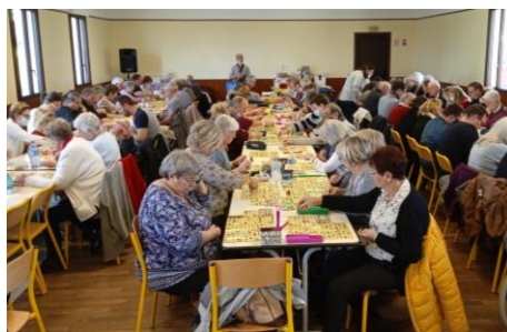
Le loto à la Poterie-Mathieu Le dimanche 7 novembre 2021