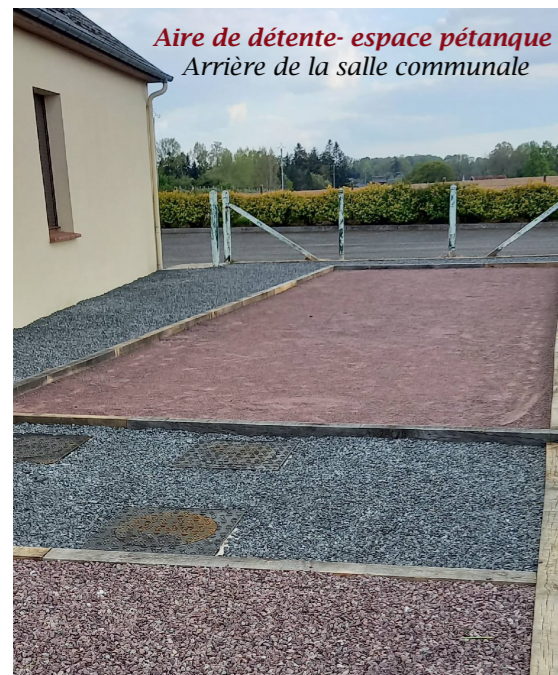
Aire de détente- espace pétanque Arrière de la salle communale