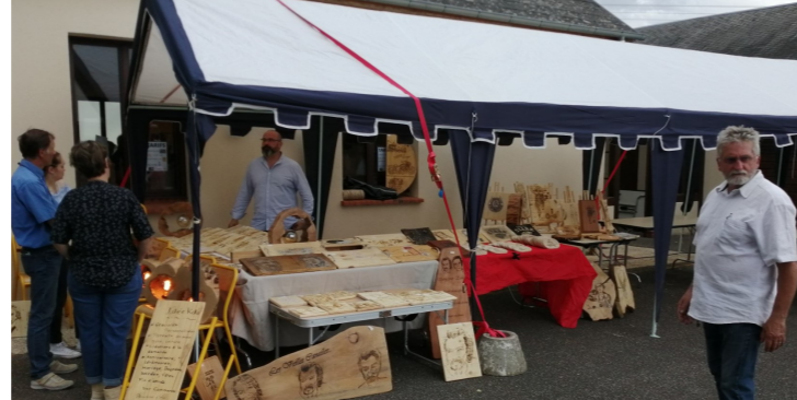
Marché artisanal dimanche 15 mai 2022