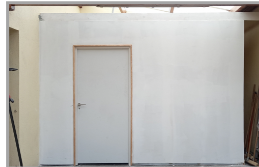
Aménagement coin enfants salle communale