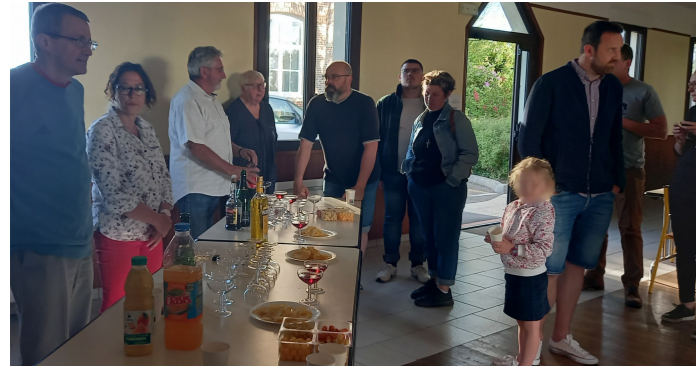
La fête des voisins vendredi 13 mai 2022