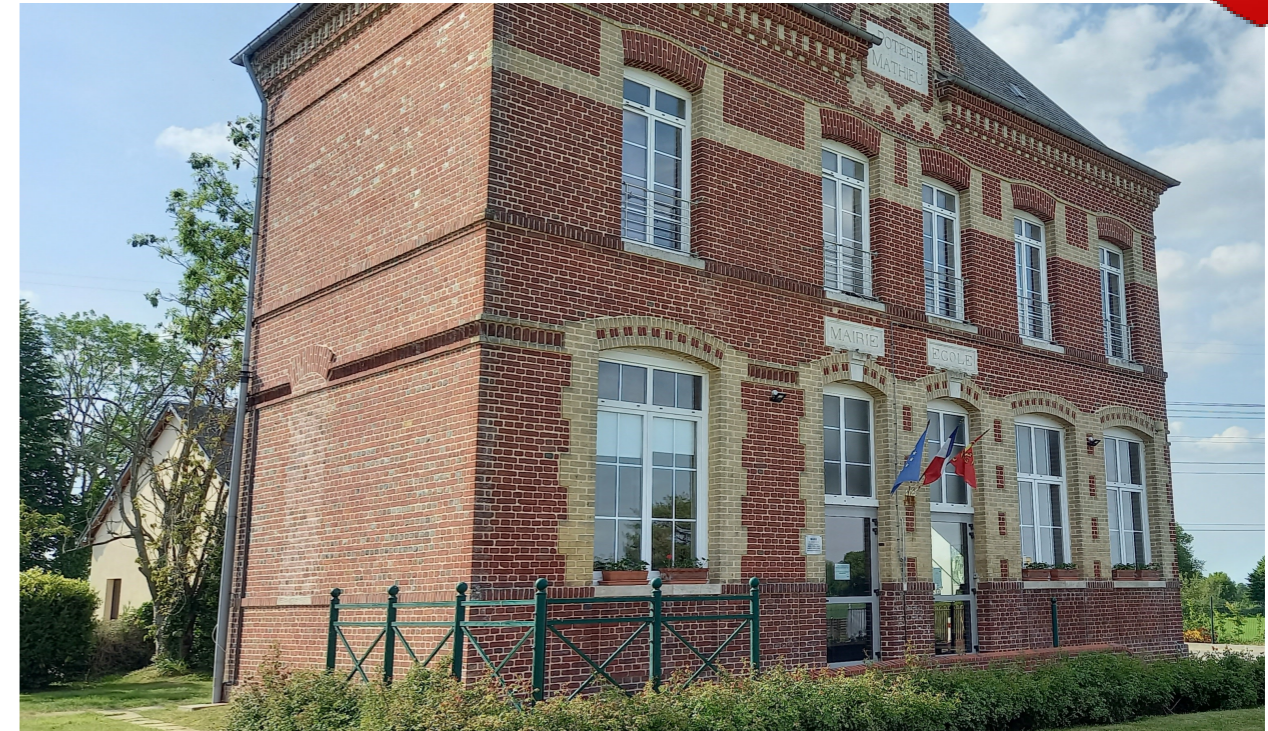
La mairie de la Poterie Mathieu au printemps...